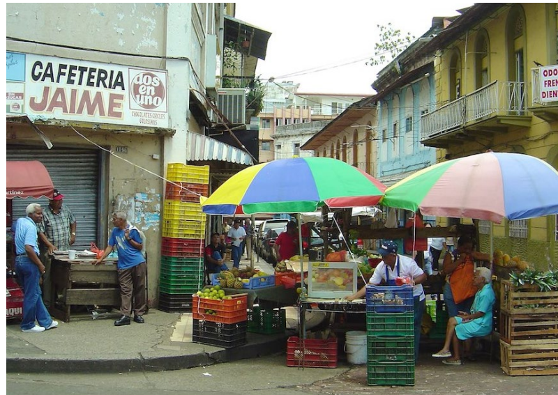
Market in Panama City.