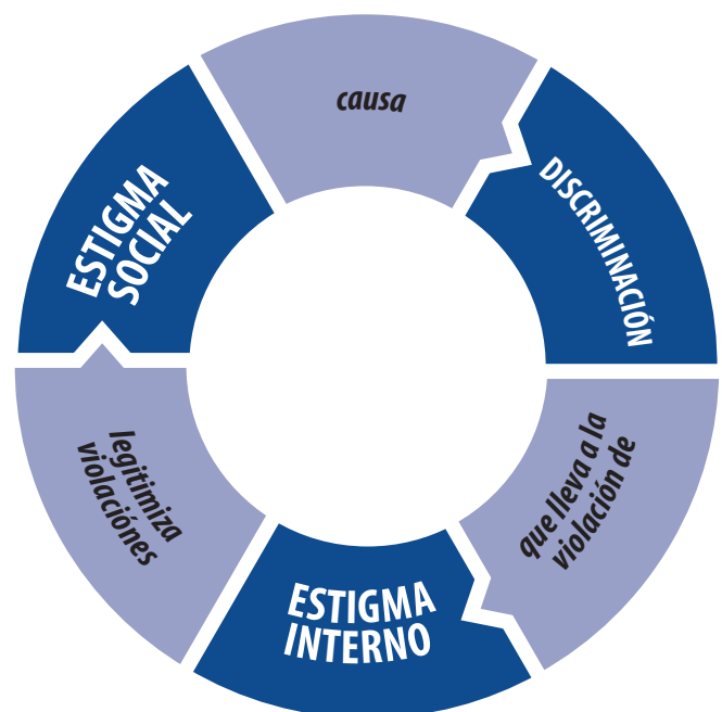
Ciclo de Estigma y Discriminación

Simultáneamente, se implementaron estudios con métodos mixtos en México y Sudáfrica. Partiendo del concepto de que la estigmatización es un proceso que produce y reproduce las relaciones de poder, los estudios en los dos países recolectaron datos de varios sectores para explorar el ciclo del estigma y la discriminación en contextos nacionales contrastantes. Se aplicaron encuestas a Personas que viven con el VIH (PVV), a proveedores de servicios de salud, en entornos legales y de formulación de políticas, en comunidades basadas en la fe y en los medios de comunicación. Una vez que las encuestas fueron contestadas y los datos analizados, emergieron tres componentes clave como puntos importantes en un ciclo de estigma y discriminación asociado al VIH: estigma social, discriminación y estigma interno.