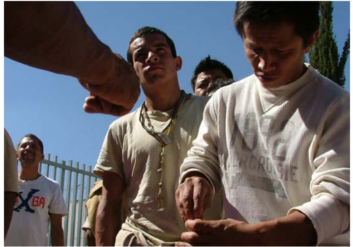
Educadores mostrando cómo usar un condón

Otra intervención dirigida que produjo importantes resultados fue el programa piloto de prevención de transmisión de madre a hijo (PTMAH) para mujeres que se inyectan drogas o que tienen parejas que se inyectan. El personal del Hospital General de Tijuana (HGT) reportó al Proyecto de Prevención Combinada de USAID que cincuenta por ciento de las pacientes embarazadas que dieron a luz en el hospital no recibieron atención prenatal; que en la mayoría de las pacientes embarazadas a quienes se les detectó el VIH, la detección ocurrió durante el trabajo de parto; y que más de ochenta por ciento de quienes se les diagnosticó con VIH eran mujeres que se inyectaban drogas o que tenían una pareja que lo hacía. USAID se asoció con la ONG Prevencasa para trabajar con más de 400 mujeres que se inyectaban drogas. Veinte de esas mujeres resultaron positivas para VIH