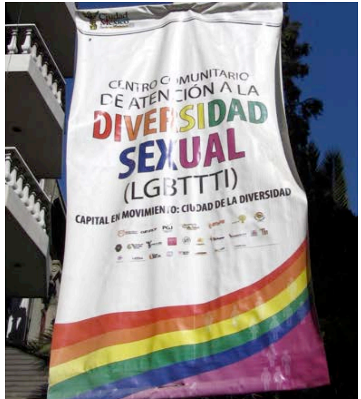
Pancartas que celebran la diversidad sexual en la Ciudad de México, D.F.

USAID tenía una larga y exitosa historia de trabajo con CENSIDA estableciendo contacto con las personas más vulnerables al VIH. USAID dio prioridad a los grupos de PVV en su trabajo y forjó alianzas sólidas y duraderas que beneficiaron a los programas de VIH por décadas. A través de su trabajo con PVV, USAID pudo darse cuenta de la importancia de trabajar de cerca con la comunidad LGBT, para ir eliminando juntos una capa de estigma tras otra, con el fin de brindar una solución a los retos de salud pública y de derechos humanos que enfrentan estos grupos. Mediante la experiencia derivada de los programas y la investigación sistemática, USAID y CENSIDA documentaron el rol que desempeñan el trabajo sexual y la migración en la epidemia y el contexto en el que hay que abordar la epidemia. Trabajando juntas, las instituciones aumentaron la comprensión general del papel de las poblaciones móviles; los riesgos asociados con el trabajo sexual masculino versus el femenino; y los riesgos asociados con el uso de drogas, con especial atención a