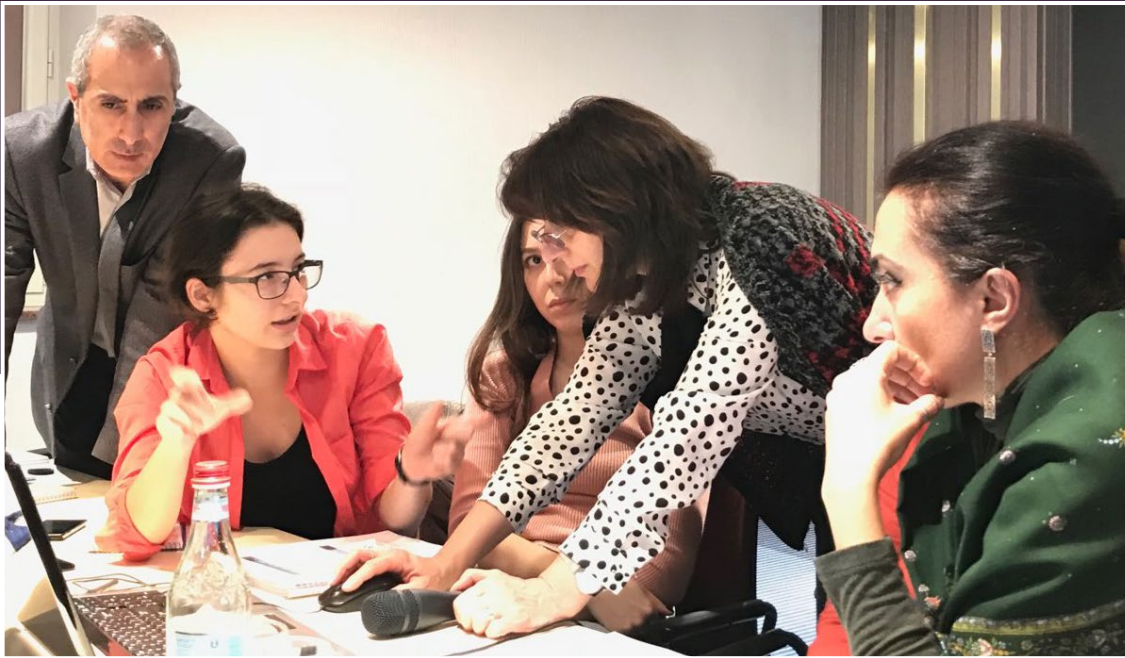
Տվյալների վիզուալացման խումբը աշխատում է ՏՊՕ և վիզուալացման դասընթացի ժամանակ, Հայաստան

պետական մարմինների և այլ շահագրգիռ կողմերի ՄԳ կարողությունները: Ստորև ներկայացված է յուրաքանչյուր երկրի վերաբերյալ տեղեկատվություն.