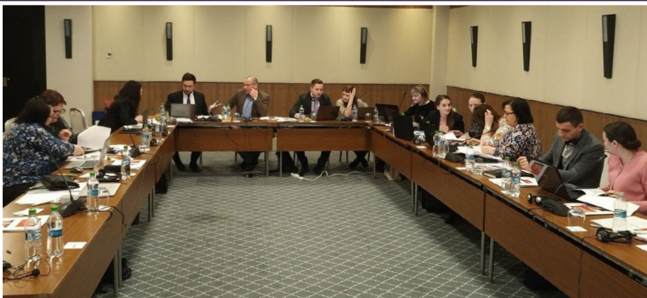
«Դեպքերի կառավարման երկարաժամկետ տեղեկատվական համակարգ» աշխատաժողովի մասնակիցներ, Մոլդովա

համար՝ հիմնվելով 2018 թ. նոյեմբերին իրականացված դաշտային այցելությունների վրա: Գենդերի, աշխատանքի և սոցիալական զարգացման նախարարության պրոբացիայի և սոցիալական ապահովության հարցերով գլխավոր պատասխանատուն կիսվել է դաշտային այցելությունների իր փորձով, որը ներկայացված է ստորև