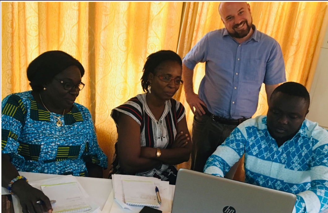
Սոցիալական ապահովության վարչություն և ՄԱԿ-ի երեխաների հիմնադրամ, Գործողությունների պլանավորման աշխատանքային հանդիպում, Գանա, Լուսանկար Մարի Հիբման, MEASURE Evaluation.

փաթեթը, որը ներառում էր 2 ծառայություն կյանքի դժվարին իրավիճակում գտնվող երեխաների համար՝ աջակցություն երեխաներ ունեցող ընտանիքներին և անհատական օգնություն հաշմանդամություն ունեցող երեխաների համար: Մուլտիվալի բոլոր շրջանները այժմ ունեն ընտանեկան աջակցության ծառայություններ, որոնք կարևոր նշանակություն ունեն բաժանման կանխարգելման և վերաինտեգրման համար: Ի պատասխան ոչ ֆորմալ խնամքի ժամանակ երեխաների պատշաճ պաշտպանության ապահովման վերաբերյալ առաջարկության, Մուլտիվալ մշակում է օրենսդրություն, որի շնորհիվ աջակցություն կտրամադրվի ոչ ֆորմալ խնամակալության ներքո գտնվող երեխաներին և նրանց խնամակալներին: