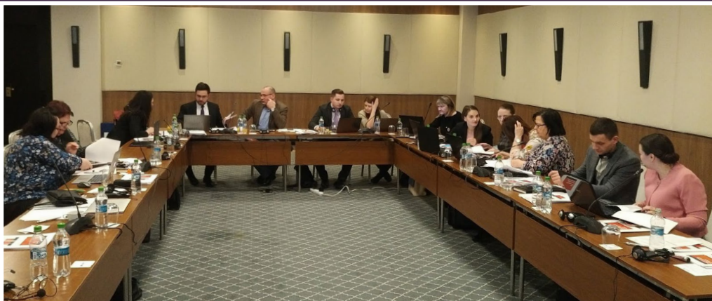
Participanții la atelierul de lucru Sistemul informațional longitudinal pentru management de caz, Moldova.