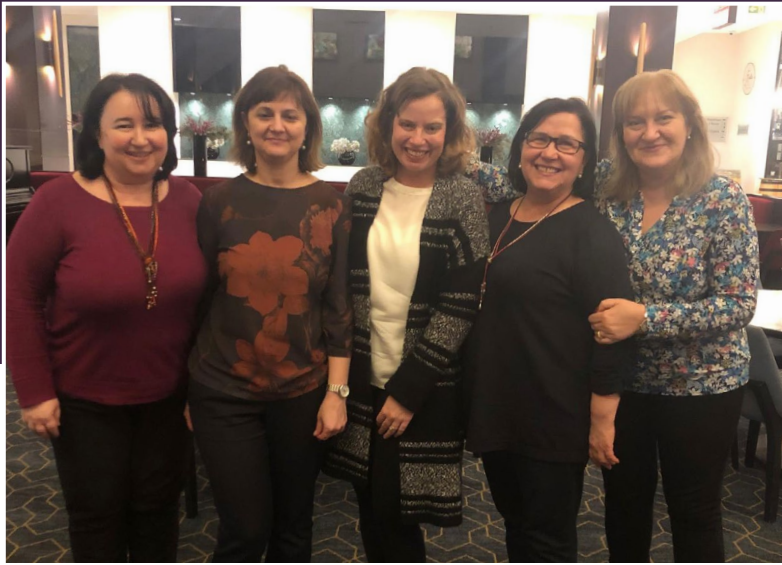
Atelierul de lucru - Sistemul informațional longitudinal pentru managementul de caz, MEASURE Evaluation, Parteneriate pentru fiecare copil, Lumos, CCF, Moldova.