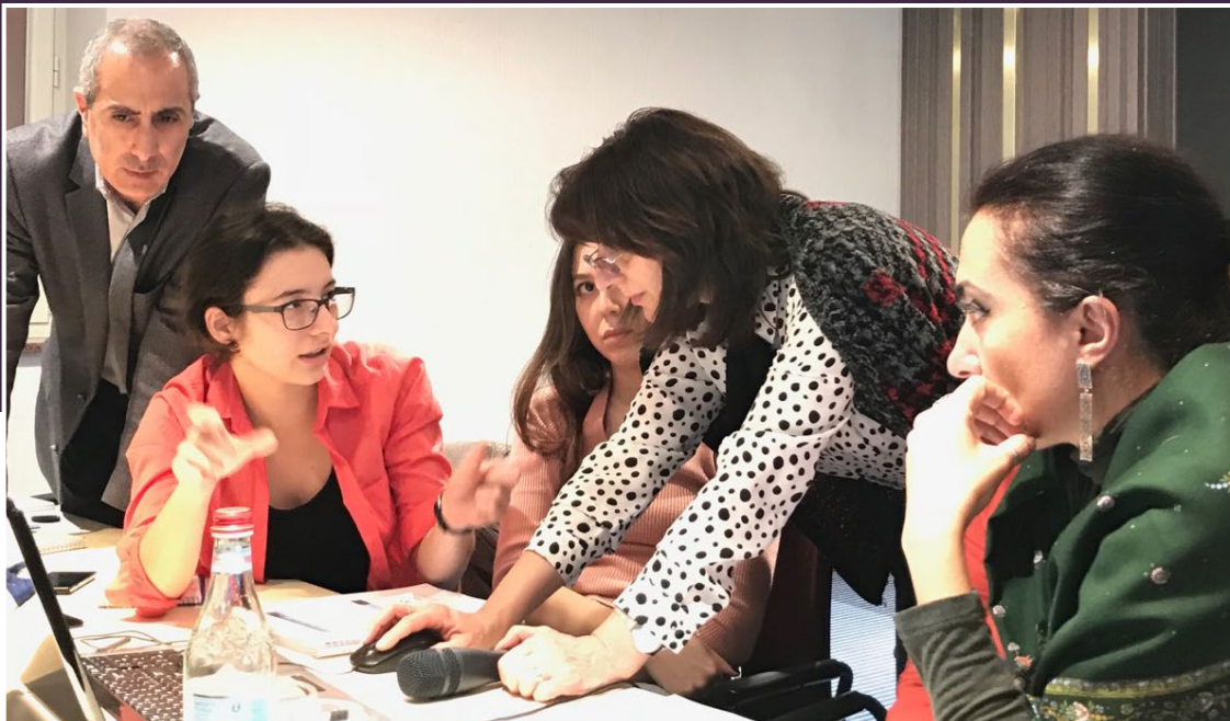
Lucrul în grup asupra vizualizării datelor în cadrul instruirii referitoare la utilizarea datelor

raportării trimestriale standard pentru funcționarii responsabili de bunăstare și asistență socială pentru a facilita raportarea către funcționarii de dezvoltare comunitară și MGMDS .