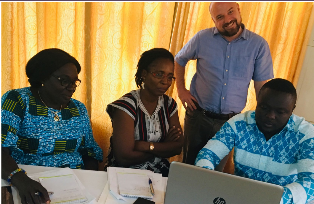
Atelierul de lucru de planificare a acțiunilor, DSW și UNICEF Ghana.