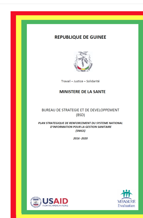
Plan Stratégique du Renforcement du SISR en Guinée